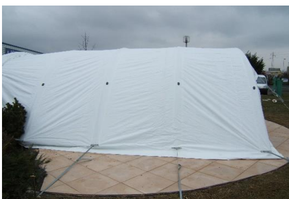
Modulo avec sangles déport