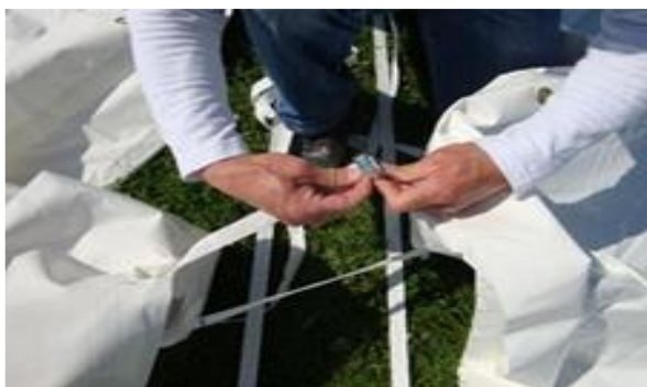
Les passer au-dessous des sangles bases