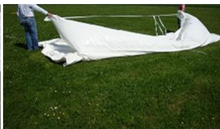
Retournement du modulo