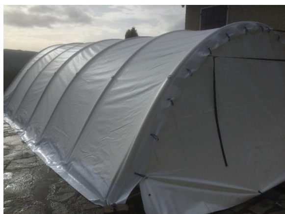
Porte installée sur ACM1 / 90