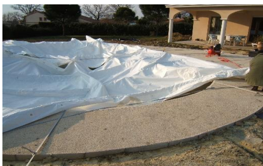
2 modulos réglés et fixés sur bassin

Attention : utiliser les sangles dallage ou sangles déport (inclus dans le kit). Celles-ci vous évitent l'utilisation de lest si vous êtes sur une surface finie. Ces sangles vous permettent de déporter la fixation au-delà du dallage (attachez-les aux 4 coins de l'abri et les fixer à 45°, voir photos) ACM1/90 : compte tenu de sa longueur, il faudra mettre en plus une sangle déport au milieu de l'abri de chaque coté