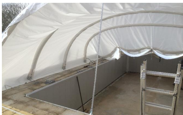
Modulos fixés en cours de gonflage vue intérieure