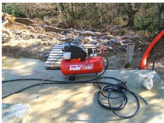
Gonfleur standard (non inclus)

Ne pas soulever la baleine avant la pression mini.