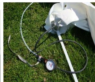
poignée bloquée par sangle ou tirap /colson