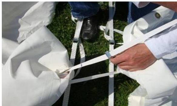
Ne pas dépasser la marque