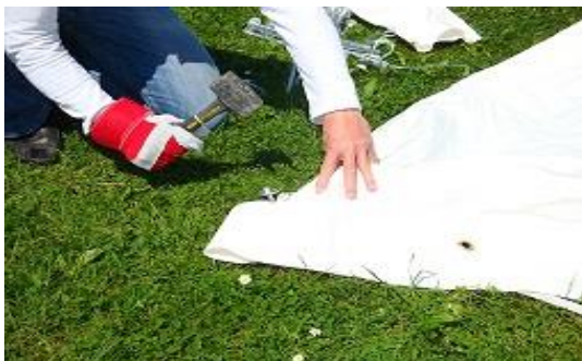
Piquet planté dans son anneau