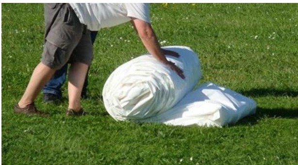
Roulage du modulo du fond vers les gonfleurs

But : facilite le dégonflage / préserve l'usure Base de Valve. Dégrafer les sangles de bases jusqu'à ce que l'abri soit complètement à plat, (il est préférable de ne pas les dégrafer complètement). Une fois plié sur sa largeur (largeur du sac), rouler toujours l'abri du fond vers les valves. Vous pouvez faire un repli d'un mètre à la fin du roulage. Cela vous aidera à la manutention de l'abri roulé puis déposer le sac à proximité de l'abri roulé et faire glisser ce dernier sur son sac puis refermer le sac avec ses sangles de serrage.