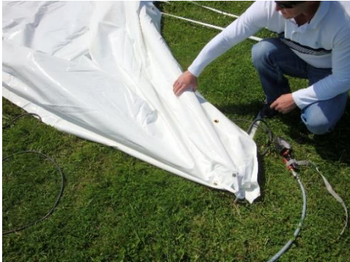
Pression de la première baleine à 6 bars

7) Après le gonflage de la première baleine, la soulever à l'aide des sangles longitudinales sans toutefois l'amener à la verticale, puis la fixer avec les sangles longitudinales