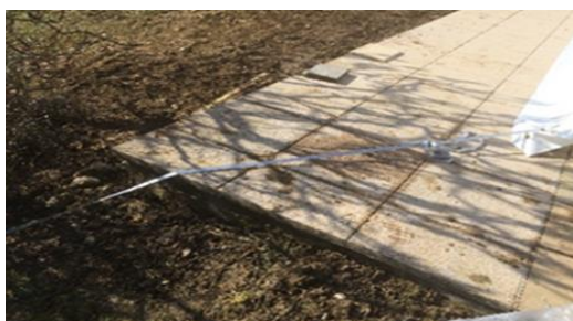
Sangles déports fixés à 45° sur dallage