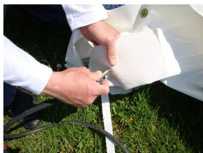
griffe de gonflage