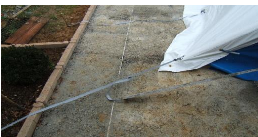
Sangles déport fixés à 45° sur béton