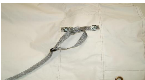
Faire coulisser la sangle déport au travers de la poignée

Attention : utiliser les sangles dallage ou sangles déport (inclus dans le kit). Celles-ci vous évitent l'utilisation de lest si vous êtes sur une surface finie. Ces sangles vous permettent de déporter la fixation au-delà du dallage (attachez-les aux 4 coins de l'abri et les fixer à 45°, voir photos) ACM1/90 : compte tenu de sa longueur, il faudra mettre en plus une sangle déport au milieu de l'abri de chaque coté