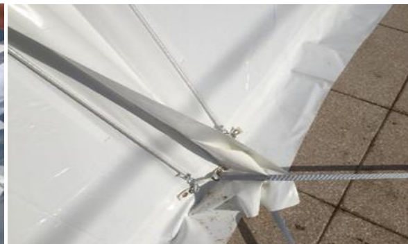
Fixation de la bâchette par ses câbles élastiques