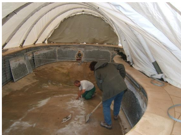
Modulo sur piscine multiforme