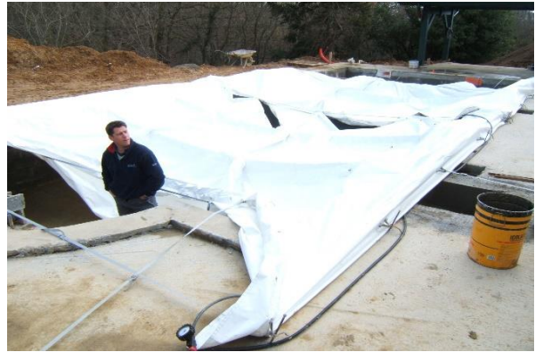
2 modulos fixés et 1 ère baleine en cours de gonflage