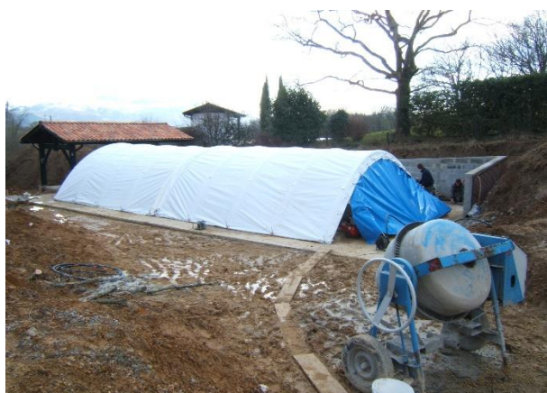
Porte inclinée = plus de longueur (0,50 m à 0,75 m)/porte