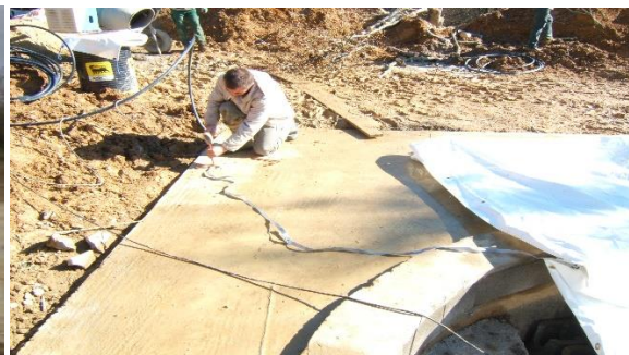
Fixation sangles longitudinales sur béton