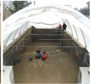
2 modulos en cours de gonflage