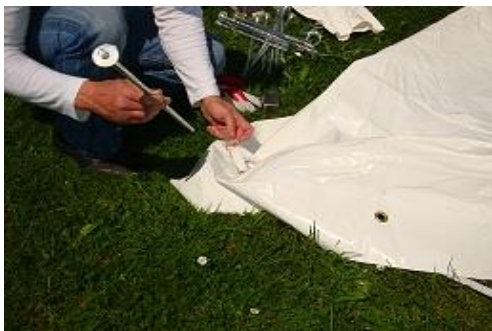
Passage du piquet dans l'anneau

4) Fixer les MODULOS à l'aide des fiches, au travers des anneaux installés à la base de chaque baleine (à la poignée de manutention).