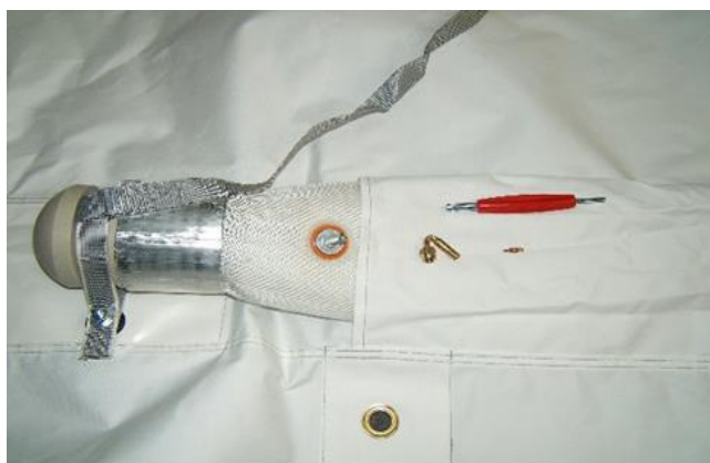
Accessoires de gonflage