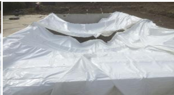
2 modulos fixés avant gonflage