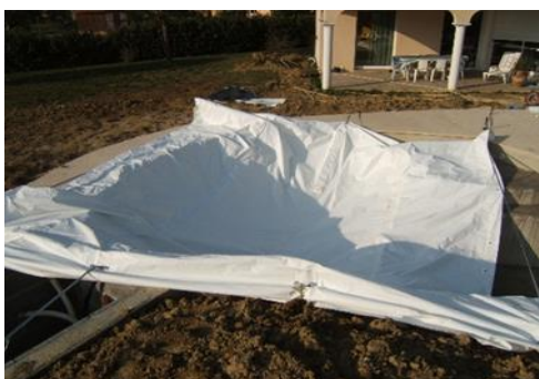
1 modulo réglé et fixé sur bassin