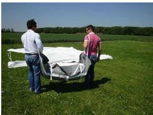
Sac porté aux bretelles

1) Ouvrir le sac à proximité du bassin sur la largeur de la piscine puis dérouler les MODULO sur le dos (baleines et passants visibles).