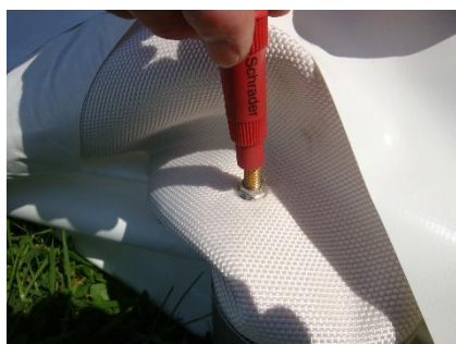
clé à obus