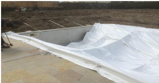
Modulo fixé avec 3 sangles longitudinales

N.B : une troisième sangle peut être installée sur la fenêtre 3