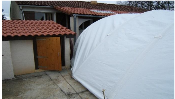
Évite les obstacles