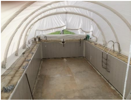
Fin de gonflage