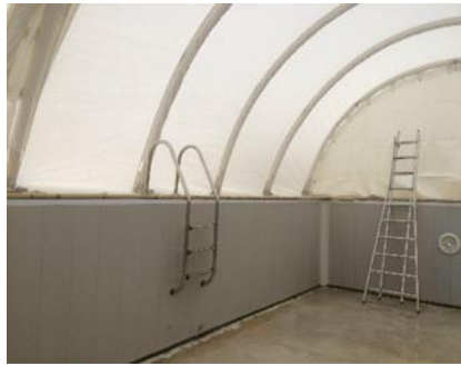
2 modulos installés