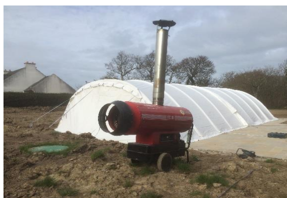
Chauffage fioul (conseillé)