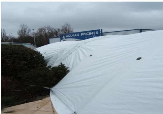
Évite les obstacles