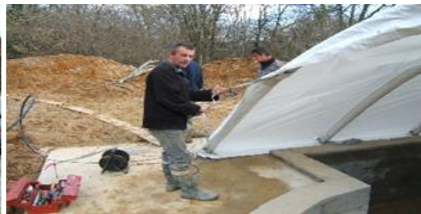
Fixation sangle longitudinale