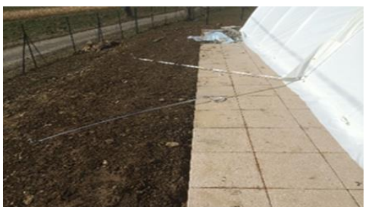
Sangles déports fixés à 45° au raccord de 2 modules