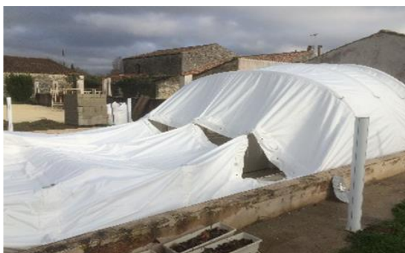
Modulos fixés en cours de gonflage vue extérieure

Pour le gonflage des tubes, il est préférable de gonfler le 1 er à 50% (3 bars), puis le second à 100% (6 bars)