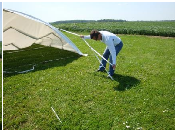
Tension des sangles longitudinales