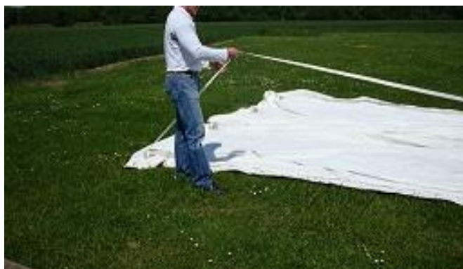
Réglage Sangles de bases

2) Régler les sangles bases (sangles reliant les pieds) jusqu'au niveau des repères (marquage noir sur la sangle pour 6 m), à l'aide de la boucle CAM. Si vous souhaitez moins de longueur ou plus, régler la CAM en conséquence.