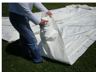
Poignée de manutention

Attention : bien aligner les MODULOS en fonction des dimensions du bassin (équerrage).