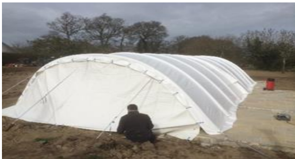
2 modulos montés avec portes