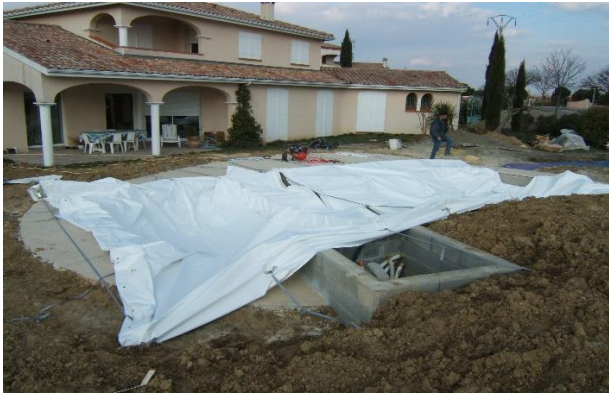
Modulo installé au-dessus d'un puit