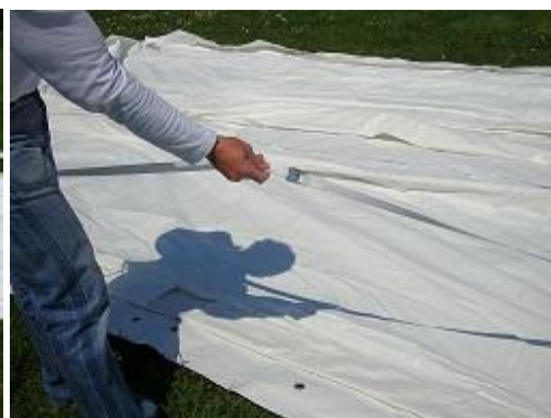
Jusqu'au repère (6 m)