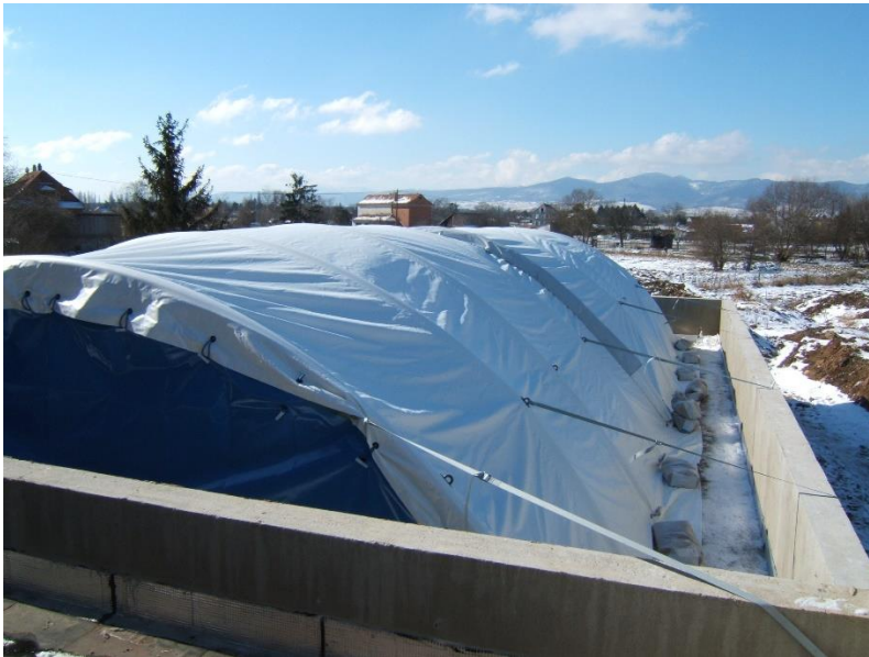
Sangles grands vents installées

N.B : Les sangles déports, les sangles longitudinales et les sangles grands vents sont toutes identiques