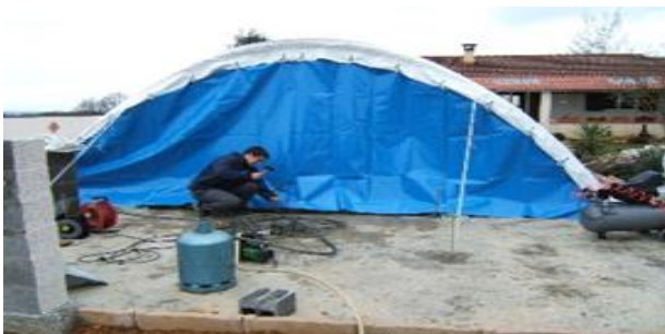
Tension bas de porte, si porte inclinée