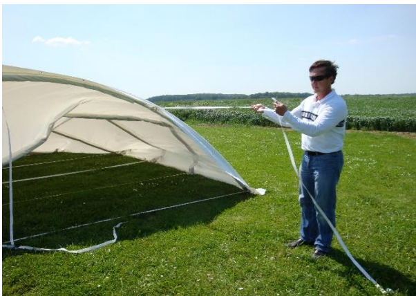
Fixation des sangles longitudinales

Lorsque l'ensemble est positionné, régler et tendre les sangles longitudinales. Ce réglage ne doit être effectué que lorsque l'abri est totalement arrondi, d'une forme régulière (répartir la tension entre les 2 sangles pour avoir une courbure régulière).