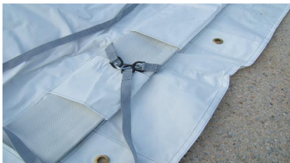
Sangles longitudinales installées sur le boyau au travers des fenêtres n° 2 (voir plan)