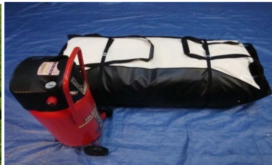
Modulo replié dans son sac (gonfleur non fourni)