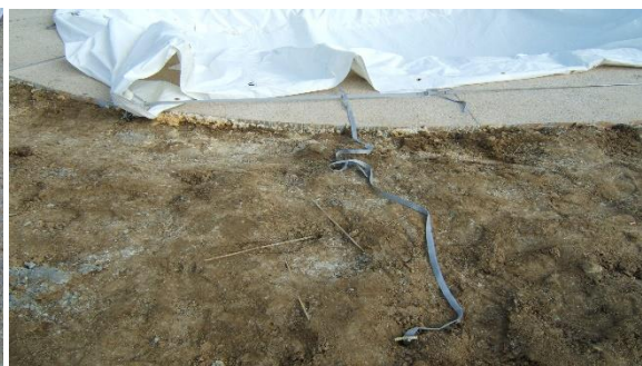
Sangles longitudinales fixés à env. 1,50 m de l'abri et non tendues