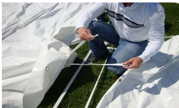
Sangles raccord X 5