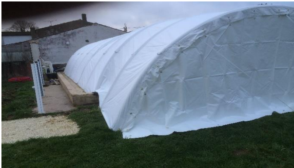
Absorbe les dénivelés