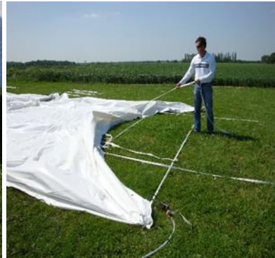
Élévation de la première baleine à 45°